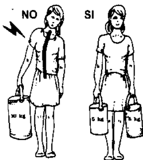
BILANCIARE SEMPRE I CARICHI